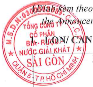
MẶT TRƯỚC/ FRONT

(Đính kèm theo Thông báo bổ sung nội dung Bản tự công bố sản phẩm ngày 06/10/2023/ Attached with the Announcement of additional of the Certificate of Self-Declaration dated on October 6 th , 2023)